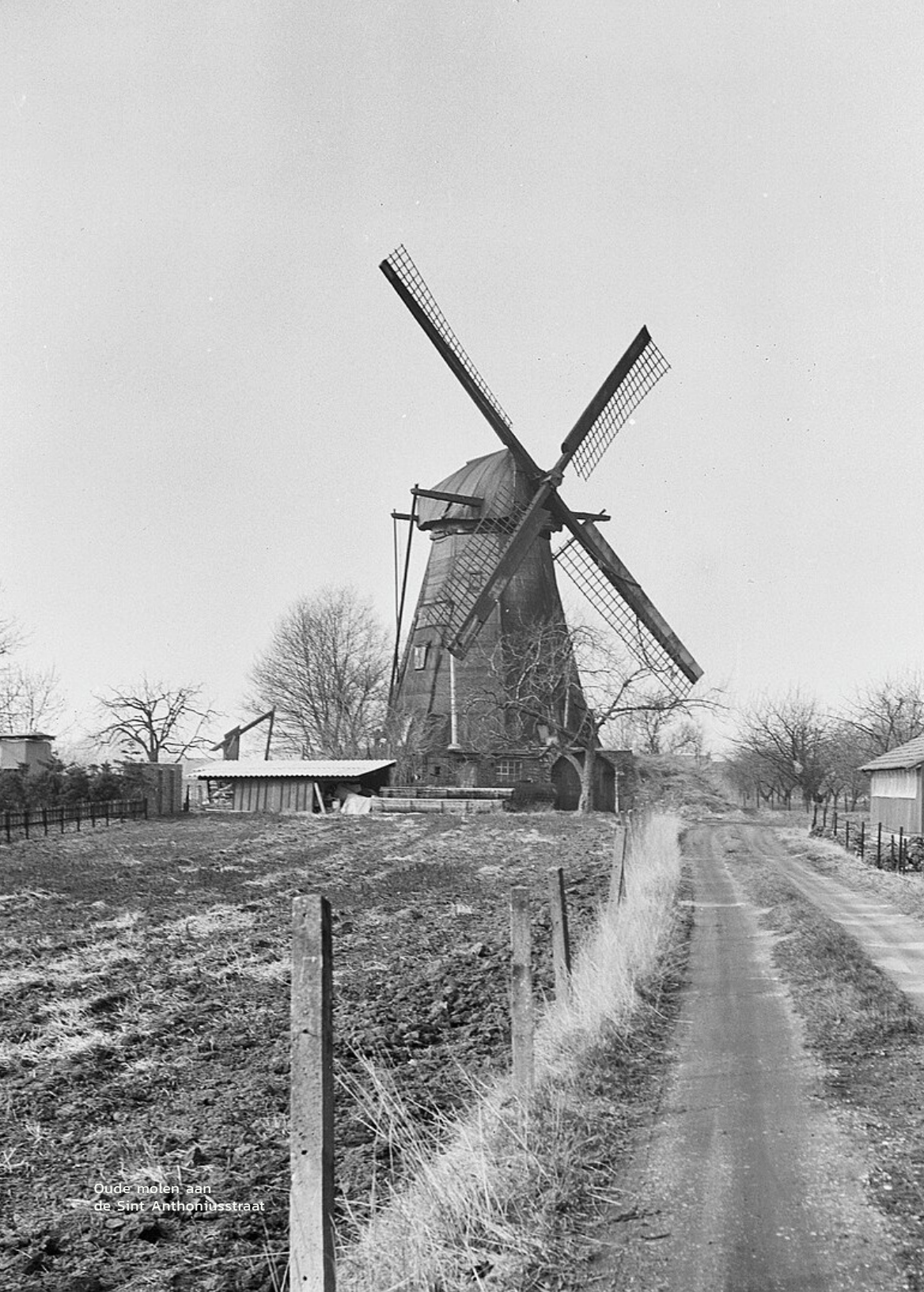
Oude molen aan de Sint-Anthoniusstraat